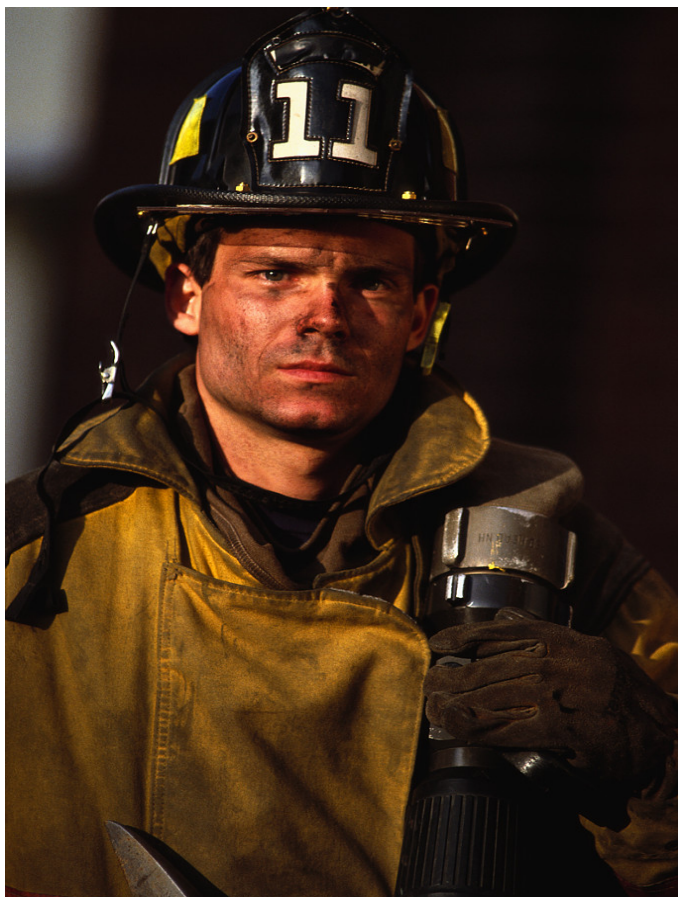
הפצה בלעדית בארץ – פיירטק מערכות בע"מ